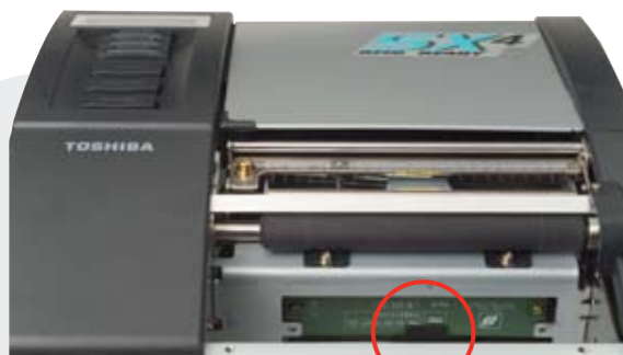
▲ Antena RFID UHF